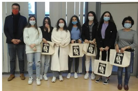
Les élèves de première spécialité HGGSP participant au Prix Bayeux-Calvados Normandie des correspondants de guerre.